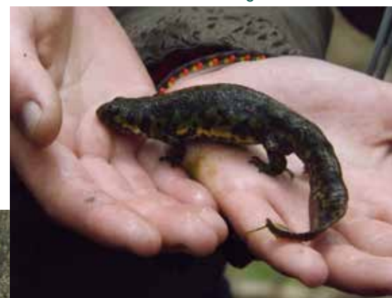
Sortie terrain à la Sagne